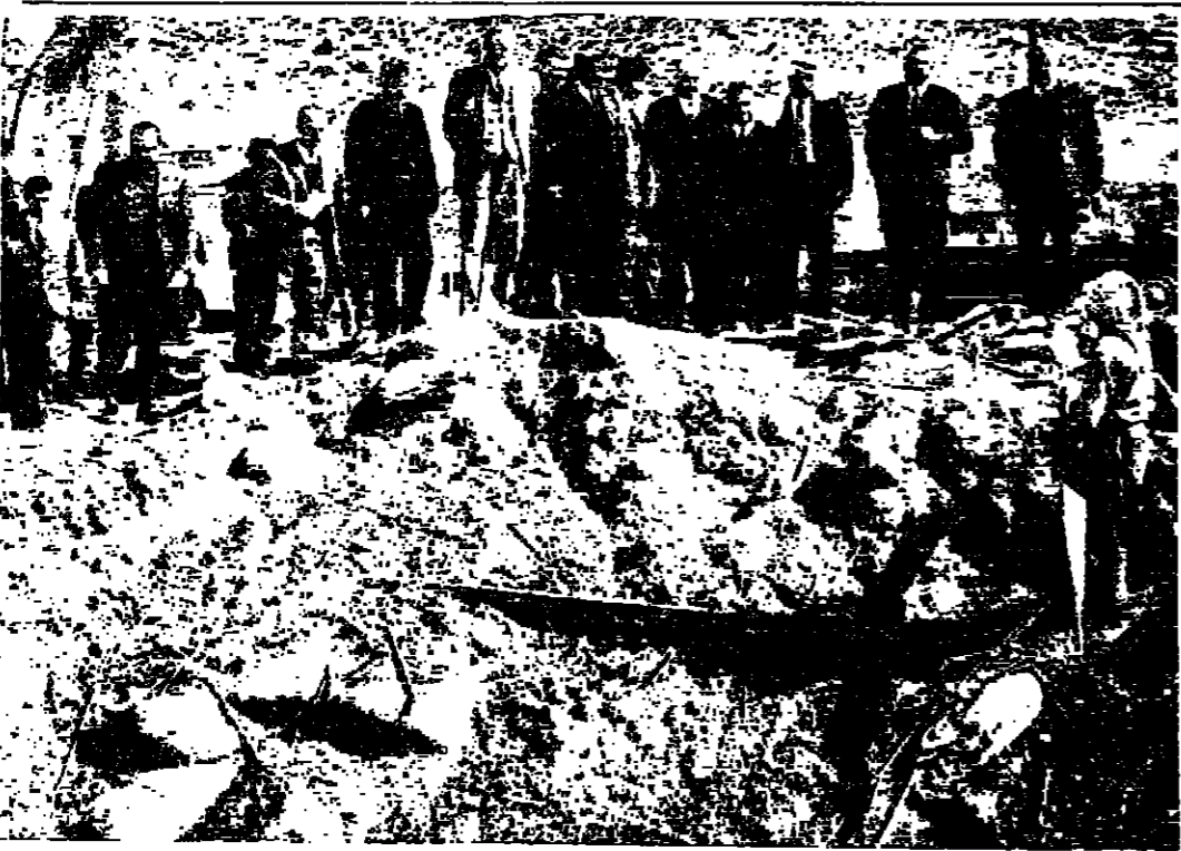
السيد بهجت التلهوني رئيس الوزراء وبعض الوزراء ورجال الصحافة خلال الجولة التقنية على المواقع التي تعرضت للعدوان يشاهدون النمر في مخزن الصاد بقرية محدي

احبكم جميعا كتم ، واتا اشد ما احبكم اعترافا بكم ، وبصوتكم ، واستعدادكم المشرف ، لبذل كل تضحية وبقاء ، فاعا من وطنكم ، وولدا عن انكم وتضيتها العاملة الجليلة .